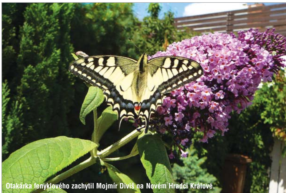
Otakárka fenyklového zachytil Mojmir Diviš na Novém Hradci Králové.

Měsíčník z Královéhradeckého kraje ▶ ročník 20 ▶ číslo 9 ▶ září 2019 ▶ cena 5 Kč