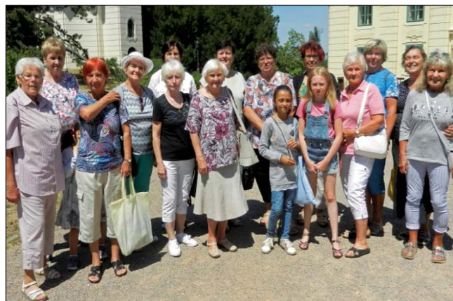
Pěkný výlet vlakem na zámek do Chlumce nad Cidlinou podnikly seniorky včetně členek LKŽ na konci června. Pěkné počasí je provázelo po městě i zámeckou zahradou.