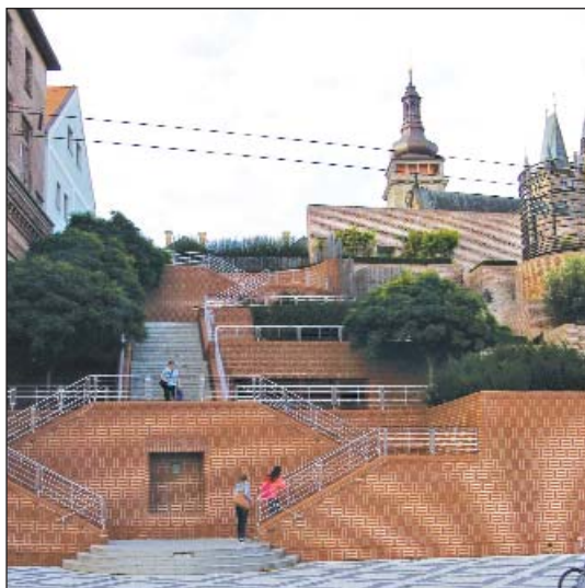
K Pivovarskému náměstí v Hradci Králové

KDU-ČSL ve vládě.) Zastupitelé následně schválili rozdělení dotací na rok 2020 – k rozdělení je 880 mil. pro nový dotační program od státu. Byla schválena spolupráce KhK s Opočnem a Dobruškou při zajištění pobytových služeb pro seniory. Nově vznikne 47 lůžek.