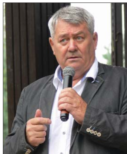
Předseda ÚV KSČM a místopředseda Poslanecké sněmovny Vojtěch Filip.

Kdo se sedmého září nezalekl mírného ranního deště a dorazil do svojšického areálu, nebyl jistě zklamán. Účastníků 29. setkání občanů přijelo téměř stejně jako vloni. Nevyskytovali se jen před pódiem, ale pod deštníky a stánky se občerstvovali, nebo poslouchali diskuse ve velkém stanu. Někteří účastníci dorazili nejen z našich dvou pořádajících krajů Pardubického a Královéhradeckého, ale samozřejmě z Prahy a dokonce z Hodonína a dalších měst.