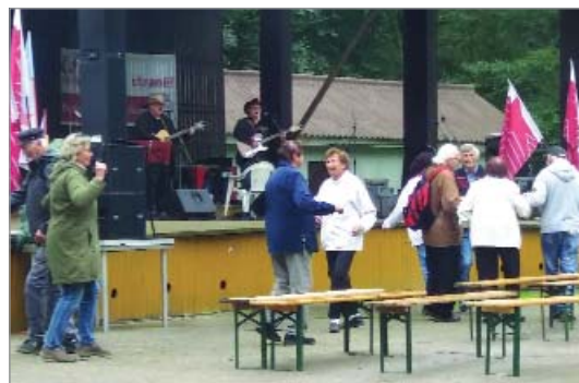
Dva borci ze skupiny DuoBand nakonec roztančili účastníky setkání.