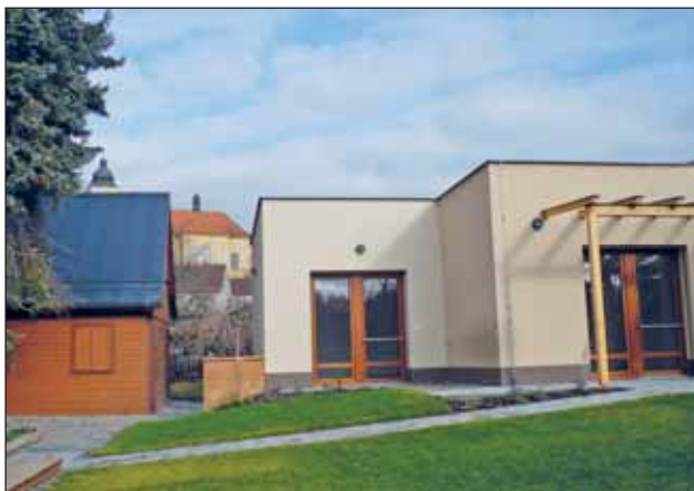
V Kostelci vyrostly dva domky se šesti byty jako chráněné bydlení.

Za posledních 30 let se situace ještě více zhoršila. Byly postaveny pouze dva bytové domy o 56 malometrážních bytech. Nyní je ve stavbě třetí bytový dům, který buduje soukromá firma. Byly upraveny některé objekty v bývalých kasárnách na byty pro sociálně potřebné. Vybudován byl i dům s pečovatelskou službou. Výstavba rodinných domů též pokulhává oproti například daleko větší výstavbě v sousedních Častolovicích. Hlavní příčinou je nedostatek stavebních pozemků ve vlastnictví města. Chystá se nová výstavba v Kostelecké Lhotě, kde na místě po zdemolované budově bývalé školy vyroste asi 13 nových bytových jednotek.