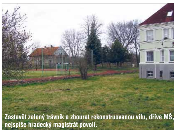
Zastavět zelený trávník a zbourat rekonstruovanou vilu, dříve MŠ, nejspíše hradecký magistrát povolí.

jíci pro rozvoj. Kukleny také požadují revitalizaci opuštěných výrobních areálů (v okolí bývalé koželuzny) a jejich užití pro novou bytovou výstavbu a zřízení provozů pro péči o starší občany. Tyto celoměstské potřeby se však střetávají s řadou potíží – a to nejen administrativních. Tím trpí zejména plánovaná a související rekonstrukce přetížené