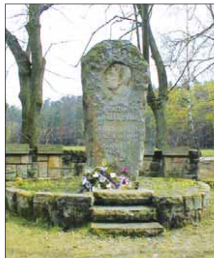
Památník ve Vysoké nad Labem u hájovny se váže k odbojové akci místních občanů, k zastřelení tří z nich a šesti sovětských zajatců.

Do činnosti partyzánských akcí organizovaných členy BARIA bylo zapojeno mnoho osob z hradeckého kraje, a také vojenské osoby, které zůstaly po dobu okupace na území Protektorátu Čech a Moravy. Za jejich statečnost a obětavost při osvobodování naší vlasti si zaslouží poděkování. Někteří z našich statečných občanů, kteří nasazovali své životy, nebo pamětníci ještě žijí mezi námi.