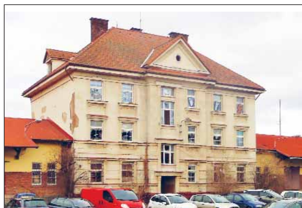
Jak dlouho ještě bude vedle exkluzivního autobusového nádraží v Hradci Králové strašit opuštěný slum? Jaroslav ŠTRAIT