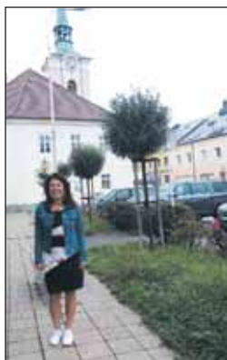
V Kostelci nad Orlicí.

Propaguji to, protože si myslím, že je to dobře. Není s tím žádná velká administrativa. Je spravedlivé, že je nevybírání nikdo ze školy. Z úřadu práce nám nahlásí, které dítě má na oběd zdarma nárok, a nikdo jiný se o tom nedozví. Kraj potom