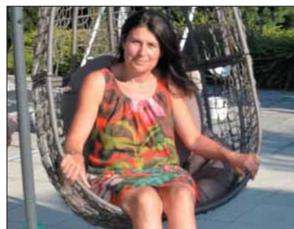
Odpočinek u maminky na terase...

Je dobré, že průmyslová zóna Solnice-Kvasiny přispívá k tomu, že v okrese je opravdu malá nezaměstnanost a lidé se