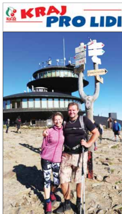
Při osmém výstupu na Sněžku podpořili Zdeněk Ondráček přátelé – i poslankyně Květa Matušovská.

● Z pozice opozice se snadněji kritizuje vládnutí složené