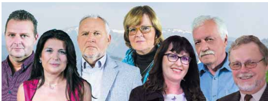
Děkujeme voličům za hlasy a kandidátům za nasazení při volební kampani!