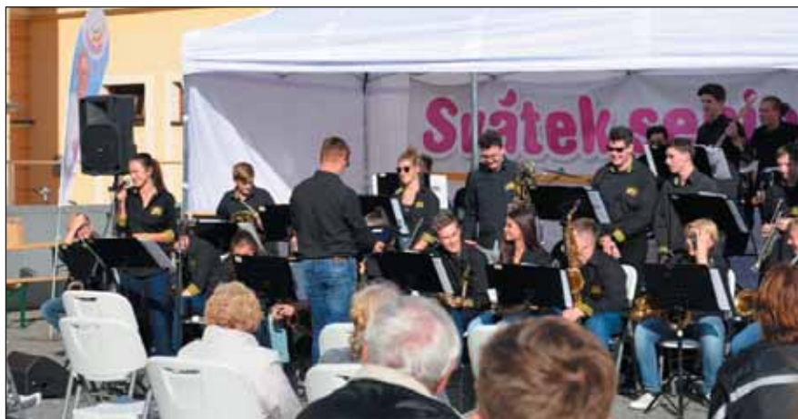
Při svátku seniorů zahráli 17. září na Pivovarském náměstí pro své prarodiče mladí hudebníci orchestru STO JAZZ Orchestra – ZUŠ Střezina. Všichni si užili ještě pěkného počasí.