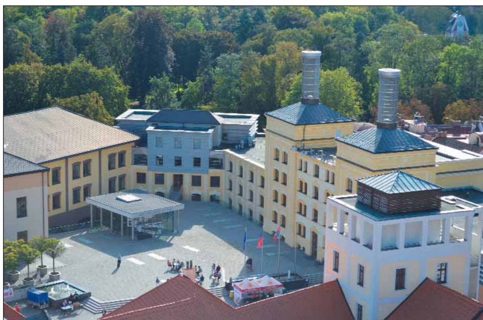
Pivovarské náměstí Hradec Králové je sídlem krajského úřadu.

Měsíčník z Královéhradeckého kraje › ročník 21 › číslo 10 › říjen 2020 › cena 5 Kč