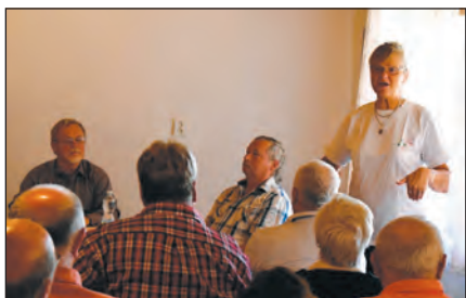
Z besedy s občany.

cizích energetických a jiných korporací,“ hovořil také o významu stotisícové demonstrace v Praze 3. září. Přítomnost předsedkyně celé strany a ostatních místopředsedů dodala akci v Sekeřicích na závažnosti a celorepublikovém významu.