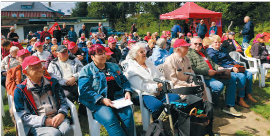
Účastníci akce na Pomezních Boudách.