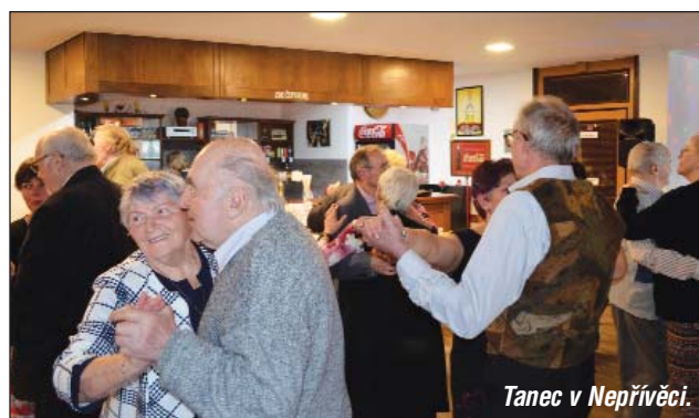
Tanec v Nepřívěci.