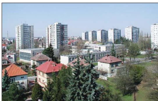
Z Pražského Předměstí jih – panelová výstavba

Je téměř nereálné zde vybudovat dostatek nových parkovacích míst, protože by to bylo na úkor tolik potřebné veřejné zeleně. V úvahu by přicházelo zřídit zde rezidentní zóny, jako je tomu v sídlišti Labská I.