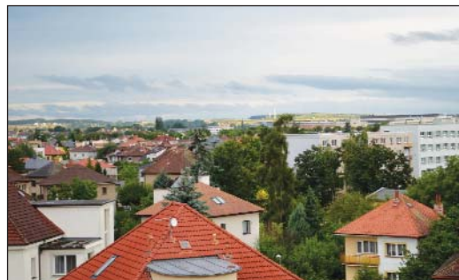
Z Pražského Předměstí jih – rodinné domky.

Strategický plán rozvoje města počítá i se zkvalitněním železniční dopravy na trati Hradec Králové – Pardubice. Pro naši KMS je to jedna z priorit, kterou se pravidelně zabýváme minimálně od roku 2016. Tehdy jsme ve svém stanovisku jednoznačně deklarovali, že zdvoukolejnění trati považujeme za koncepčně správné a umístění druhé koleje jsme považovali za vhodné umístění vpravo od stávající koleje ve směru na Pardubice. Naopak mimoúrovňové křížení železniční trati s komunikací v ulici Kuklenská jsme nepovažovali z koncepčního i ekonomického hlediska za šťastné řešení. V tomto ohledu po celou dobu zastáváme konzistentní názor, na rozdíl od zastupitelstva a vedení města, které své názory na řešení několikrát změnilo. Současné vedení města dalo najevo, že se bude snažit zaujmout konstruktivní přístup k řešení sporů s občanskými iniciativami, a to v rámci platné legislativy a norem. Předpokládám, že u zmiňovaného přejezdu zvítězí rozum, a bude proveden jako plnohodnotný úrovnňový přejezd. Vycházíme z předpokladu, že po dokončení Jižní spojky se významný podíl silniční dopravy směřující z Kuklen na Pražské Předměstí a naopak přesune na tuto tangentu a přejezd v Kuklenské ulici