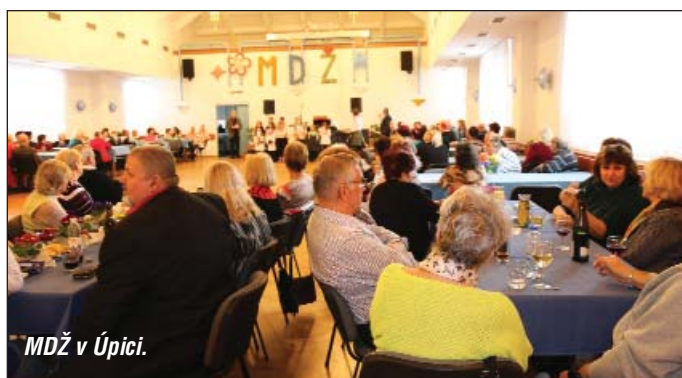
MDŽ v Úpici.