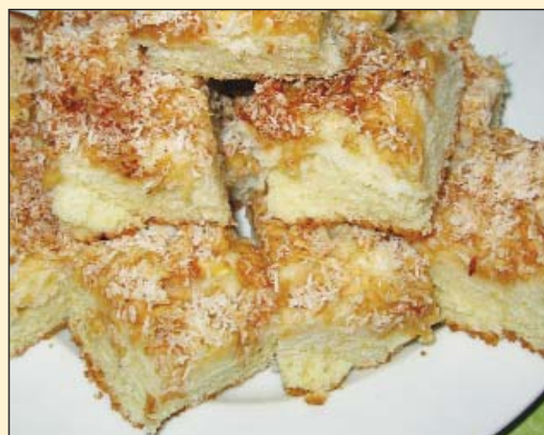
Řezy od Mileny