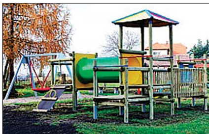
Nové dětské hřiště v Bolehošti.

Co by obec potřebovala. U základní školy je nutná výstavba dalšího oddělení MŠ, které je v plánu. Místní občané by rádi udrželi v chodu provozovnu České pošty. Bude to těžké s příchodem elek-