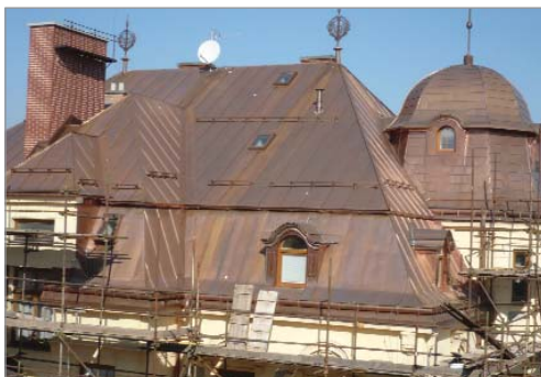
Jednou z posledních velkých investic ve sféře sociálních věcí byla rekonstrukce střechy Domova seniorů ve Vrchlabí.

Vyrovňovací platba vychází z počtu obsluhovaných klientů, počtu sociálních pracovníků i časovém rozsahu poskytovaných služeb. Je nutné zdůraznit, že na financování se podílí jak kraj, tak i ministerstvo práce a sociálních věcí, které finanční prostředky převádí na kraj a ten je výše vzpomínaným způsobem rozděluje. Na provozu jednotlivých služeb se pochopitelně podílejí svou platbou i klienti.