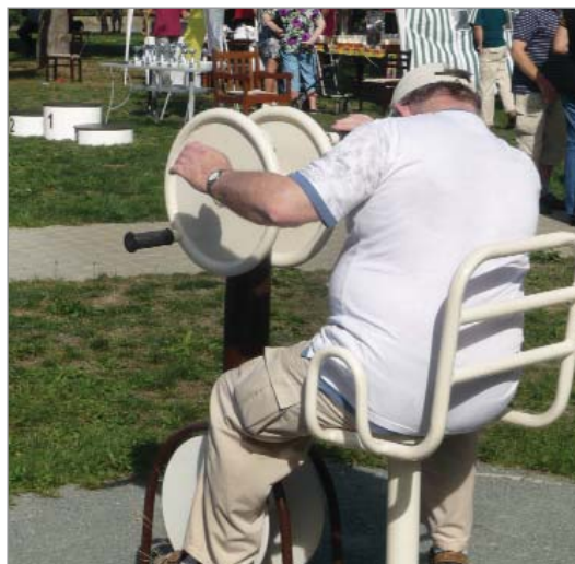
Aktivní stáří, to je společný cíl města a kraje – snímek je z Fit parku u domova zvláštního určení Harmonie Hradec Králové.