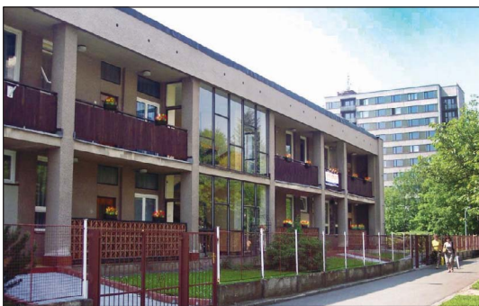
Objekt pro stacionář pro seniory v Trutnově.

Iva Řezníčková, zastupitelka Trutnova a KSČM