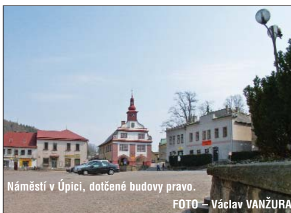
Náměstí v Úpici, dotčené budovy vpravo.

ní pracoviště a zejména prostor pro depozitář muzea, který se dříve neřešil, ale ze zákona je nutností. Taktéž šlo o uvol-