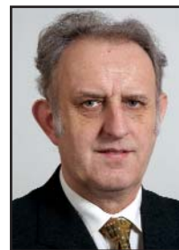
Otakar RUML, 1. náměstek hejtmana Královéhradeckého kraje

V současné době kraj poskytuje ze svého rozpočtu ročně 5,5 milionů na stipendia v učňovských technických oborech a jsme rozhodnutí v tom pokračovat i v dalším období. Jsem přesvědčen, že větší významnou motivací pro učně či studenty by byla stipendia od možných budoucích zaměstnavatelů a jejich další podpora, o níž byla řeč výše. Možná důležitější než finanční podpora je navázání kontaktu budoucího zaměstnance s budoucím zaměstnavatelem, tedy vztahy, které existovaly dříve a osvědčovaly se.