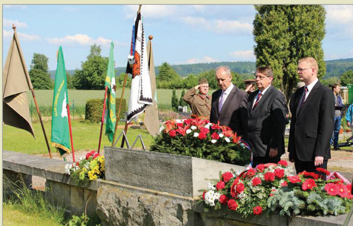
Choustníkovo Hradiště 2015

na 17. pietní shromáždění občanů k uctění památky obětí pochodu hladu a smrti z koncentračního tábora, které se koná